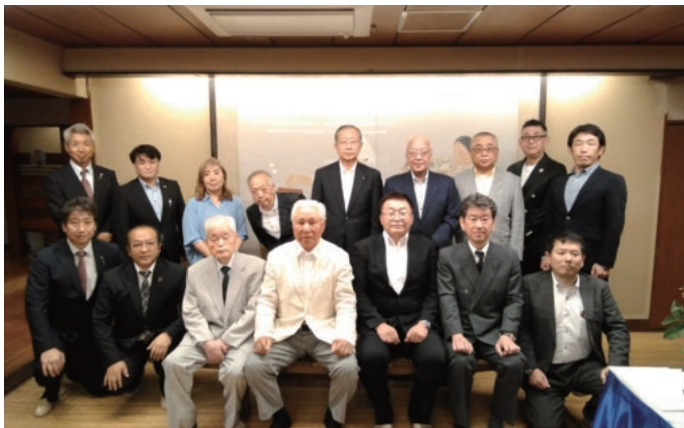
7/6 歴代会長・幹事会