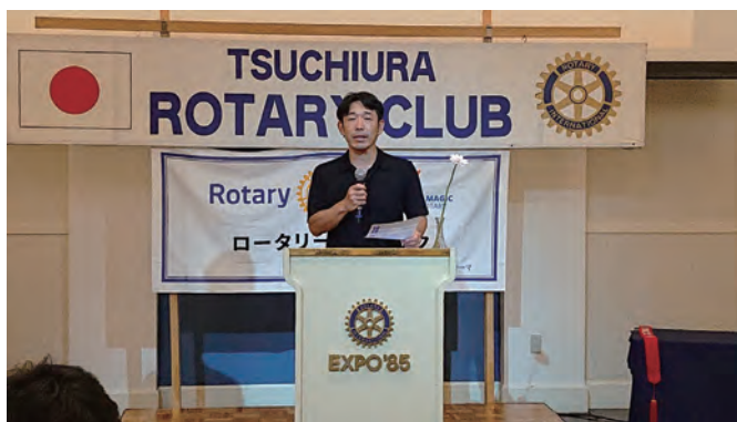
關本会員より薪能のお知らせ