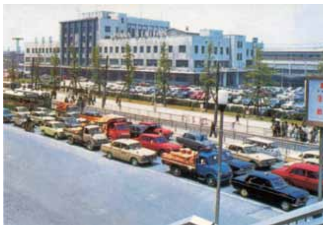
日本昔自動車風景 ～一枚の絵はがきから～