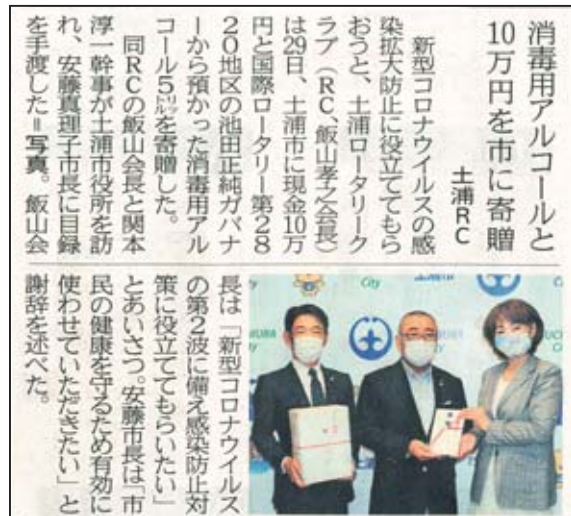
7月31日発行の茨城新聞に掲載されました