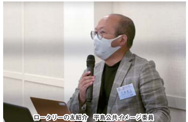
ロータリーの友紹介 平島公共イメージ委員