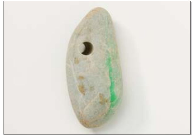
土浦ミュージアムコレクション No5 ヒスイ製大珠

御りょう遺跡(木田余)で出土した、ヒスイで作った垂飾です。縄文時代中期のもので、長さ7.6cm、紐を通す穴があげられています。ヒスイは茨城県では産出しないため、遠方から入手した貴重品だったのでしょうか。 (上高津貝塚ふるさと歴史の広場蔵)