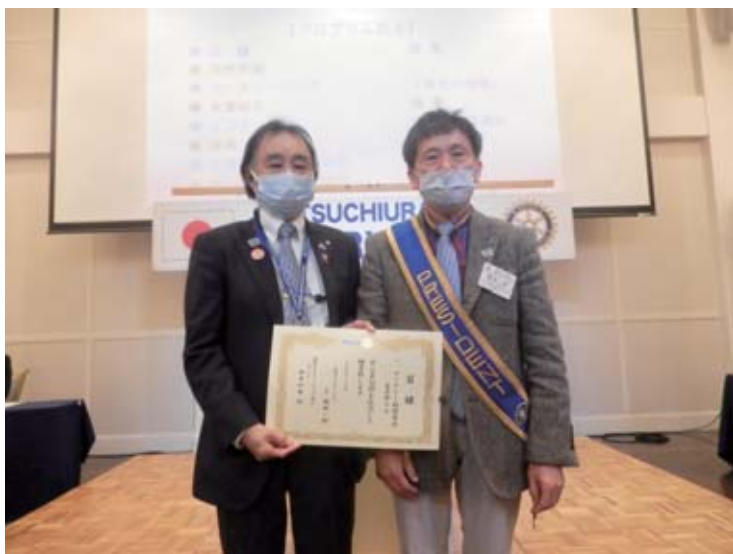
ロータリー財団、米山記念奨学会への寄付 目録贈呈