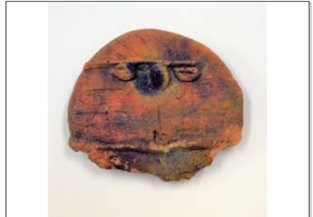
土浦ミュージアムコレクション No.12 山形土偶

神立平遺跡(神立町)で出土した縄文時代後期中葉の土偶です。この時期の関東地方の土偶は、尖る頭部から山形土偶と呼ばれています。丸い鼻、ひげのような模様……まるで未来から来たネコ型ロボットのようなですね。 (上高津貝塚ふるさと歴史の広場蔵)