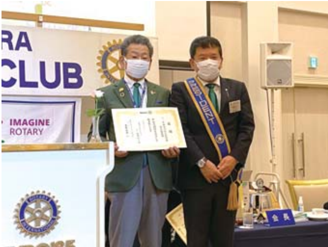
米山記念奨学会寄付 (30万円)