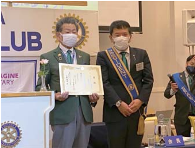
ロータリー財団寄付 (1,000ドル)