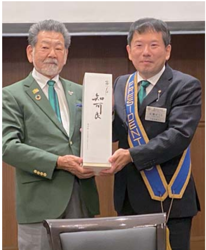
大野ガバナーより、浦里酒造（浦里地区副幹事の会社）の名酒「霧筑波・知可良」を頂戴しました♪