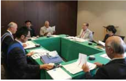
ガバナー・ガバナー補佐・会長・幹事 副会長・副幹事による事前協議会