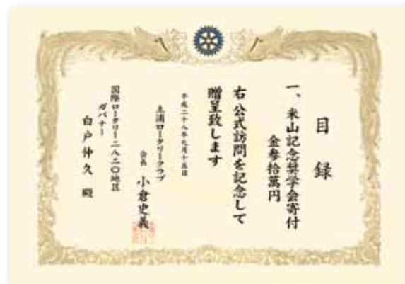
ロータリー財団、米山記念奨学会の寄付 目録贈呈