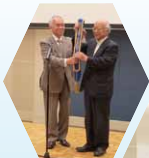
次年度の会長・幹事へ 襷の交換