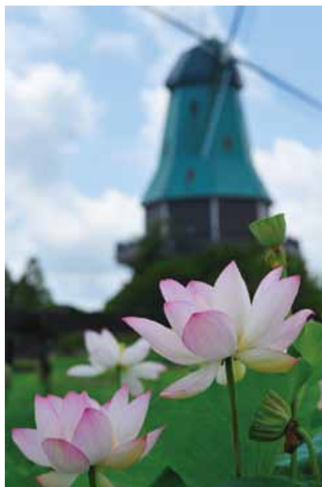
『霞ヶ浦総合公園と蓮』