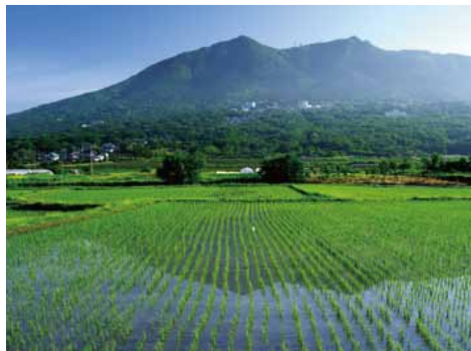
『つくば市神郡』