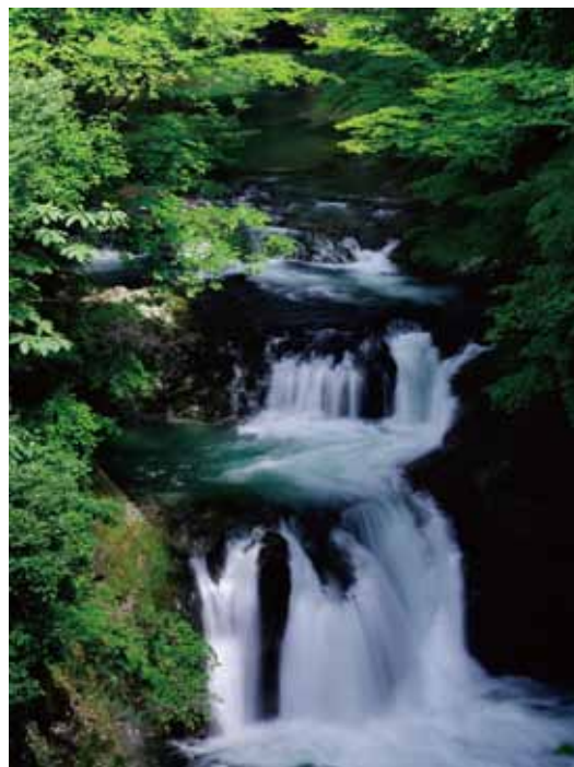
『蔵王ハイライン鳳鳴四十八滝』