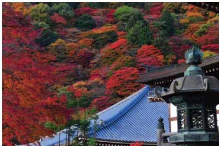
『京都 善峯寺』