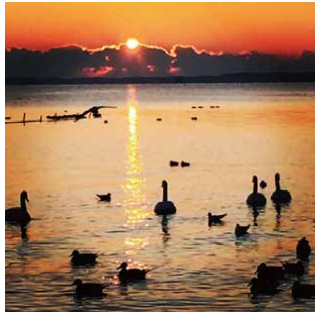
『初日の出 霞ヶ浦総合公園』