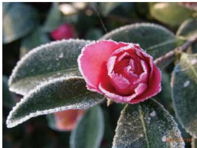
『一輪の山茶花』