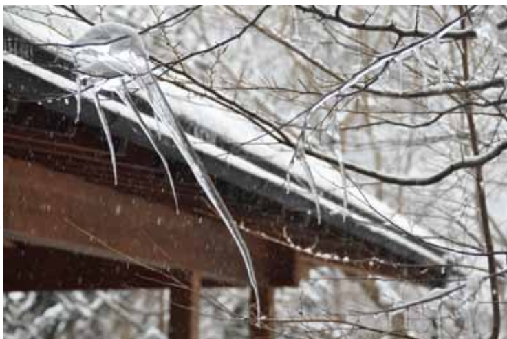
『氷柱 松本扉温泉』