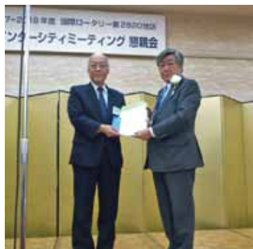
RIからの感謝状 (ポリオ撲滅)