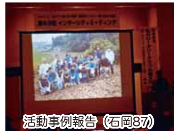
活動事例報告 (石岡87)