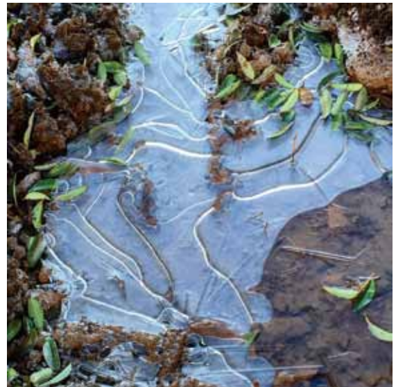
『氷の世界』