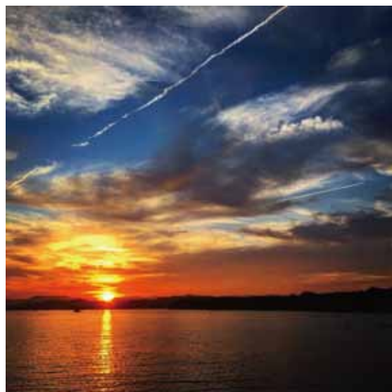
『英虞湾の夕日』