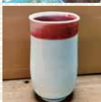
台北陽明RCへのお土産