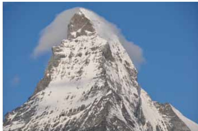
『マッターホルン』