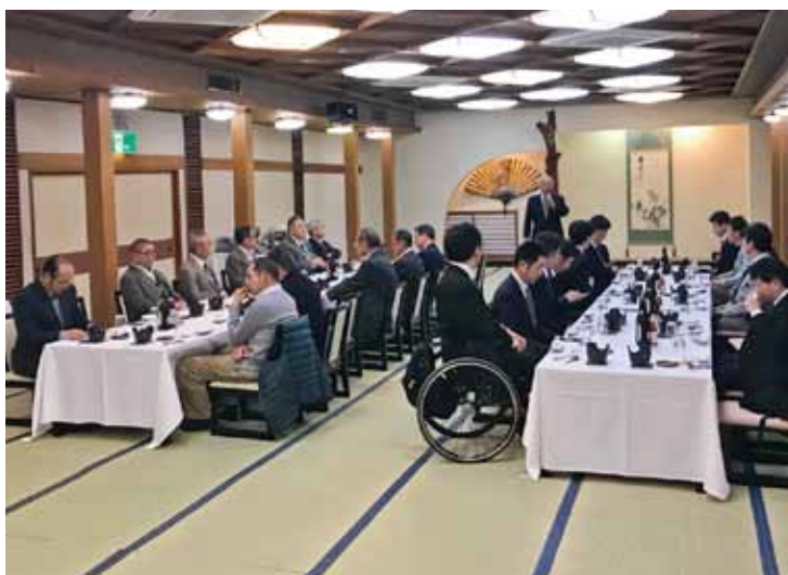
31名にて盛大に開催