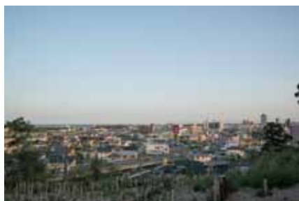
緑の段丘 二中からの眺望