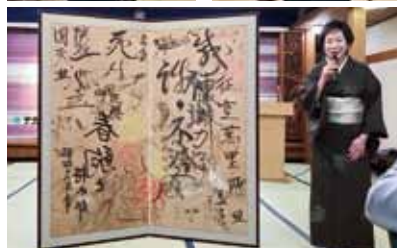
女将による霞月楼秘蔵の屏風の解説 (特攻前の宴で士官達が残した寄書き)