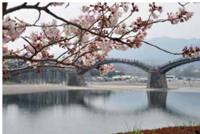
『錦帯橋の春』 写真提供：鈴木敏之 会員