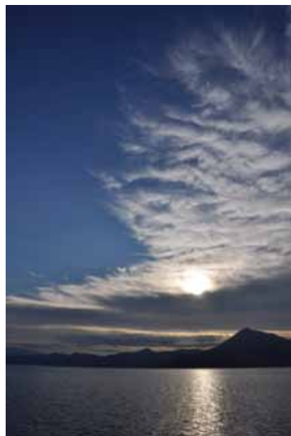
『支笏湖の夕日』