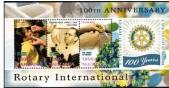
ロータリー・クラブ100周年、タンザニア(2005) ジョナス・ソーク、経口ワクチンの接種風景などが描かれる。