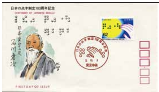
日本の点字制定100周年、初日カバー(1990) 切手には「てんじ」と点字がエンボス加工されている。初日カバー挿絵部分には日本式点字を考案した東京盲啞学校教員・石川倉次の肖像が描かれている。