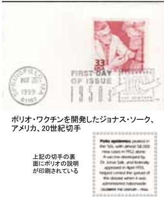
ポリオ・ワクチンを開発したジョナス・ソーク、アメリカ、20世紀切手

ポリオワクチンを開発した2人の偉人が2006年にアメリカの通常切手として発行された