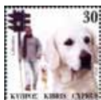
盲導犬(ラブラドル) と盲人男性ユーザー (白杖使用)。 キプロス(2006)