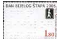
白杖の日を表す“DAN BIJELOG ŠTAPA”の点字エンボスと白杖歩行者のシンボルマークが描かれる。 (クロアチア、2006)