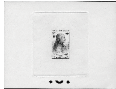
セビア・ダイ・ブルーフ