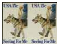
Seeing eye 50年 盲導犬(ジャーマン・シェパード)。アメリカ(1979) 無目打(エラー)