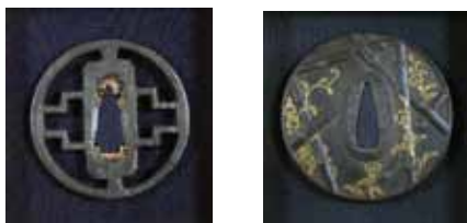
左 金山鏢(かなやまつば)材質鉄 室町時代 右 秋田正阿弥伝内(あきたしょうあみでんない) 鉄 金 江戸中期頃