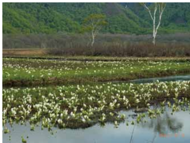
『尾瀬ヶ原』