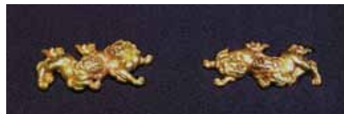
後藤顕乗 後藤本家7代 材料 金無垢 江戸時代初期