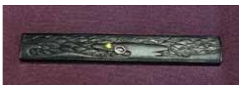
後藤栄乗 後藤本家 6代 赤銅 金 他 江戸時代初期