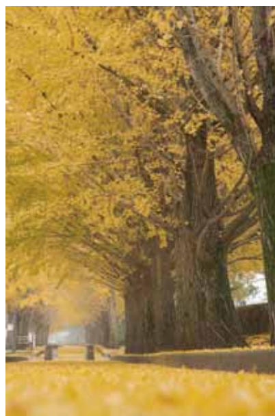
「平成土浦百景」乙戸沼公園銀杏紅葉