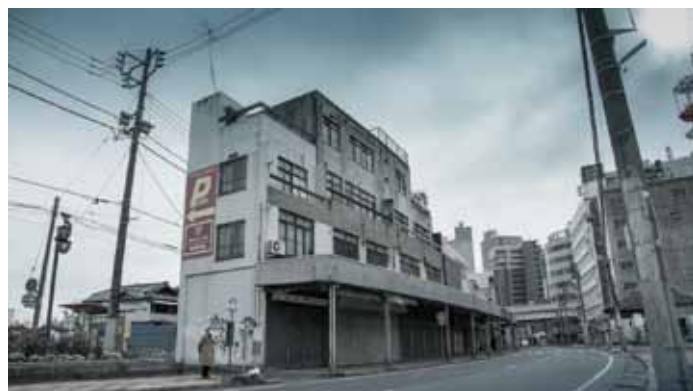
「平成土浦百景：旧市街の思い出