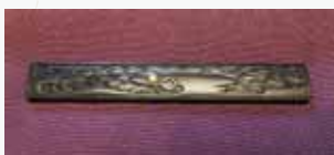
高田会員が持参されたお宝 海浜図小柄銘栄乗作光理