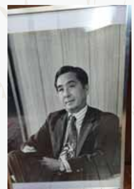
神林先生の若いころの写真