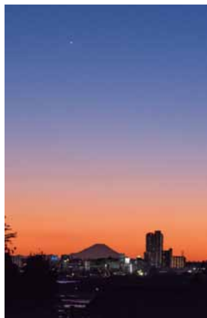
「平成土浦夜景：富士山と金星火星・手野」