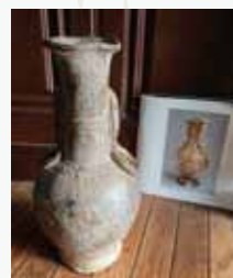
瀬戸鉄釉印花分化瓶14世紀