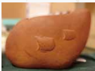
昭和33年土浦RC創立記念の工芸品 花器