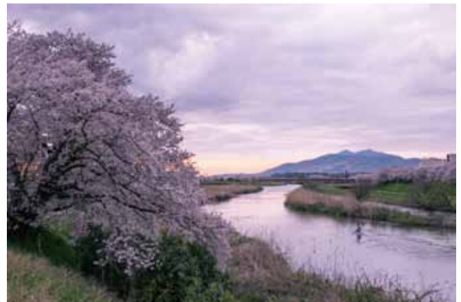
「平成土浦百景：桜川の桜 上高津」