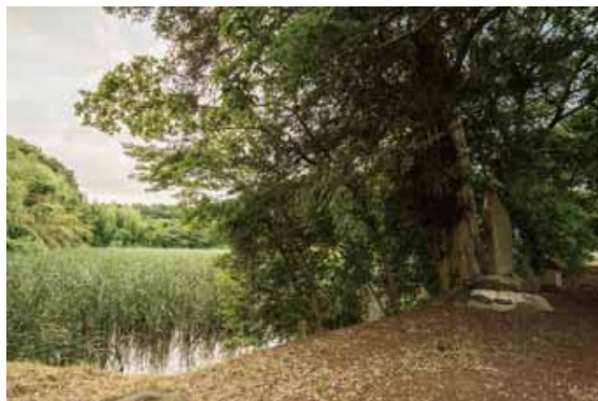
「平成土浦百景：常名ため池