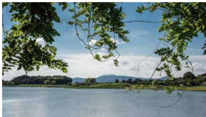
「平成土浦百景：鶴沼初夏 写真 せき こう氏」