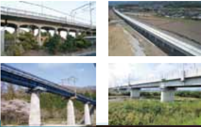
北海道新幹線・北陸新幹線・九州新幹線 etc

仕事としては、設計した内容が具体的に完成し、実際に出来上がったものを観れる喜びや多くの方が利用する鉄道事業に携われたことは今も大事な経験・思い出として残っています。