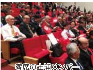
客席の土浦メンバー