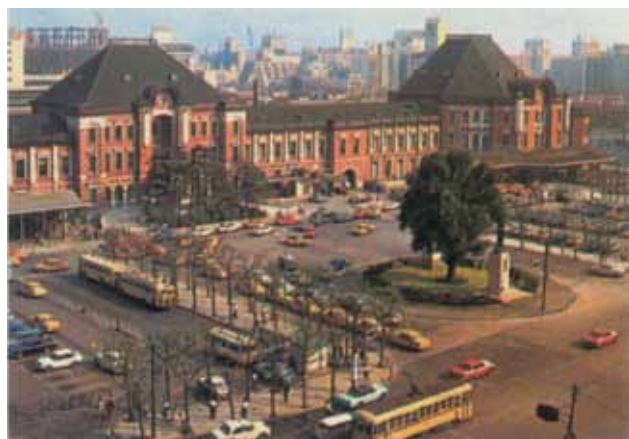
日本昔自動車風景 ～一枚の絵はがきから～