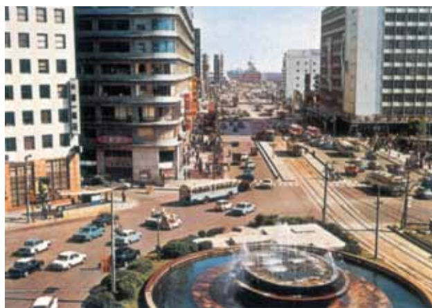
日本昔自動車風景 ～一枚の絵はがきから～ (文：高井 淳 氏 / 企画・製作：ノスタルチ屋)

愛知県名古屋市の名古屋駅前付近、昭和40年前後の風景です。現代の目で見てもゆとりのある広い道路が特徴の街並みに様々な自動車達と共存する路面電車（明治36年に開業し昭和49年に廃止された名古屋市電です）の姿があります。