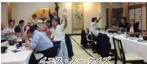
イエス・ノークイズ