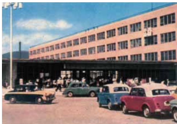
日本昔自動車風景 ～一枚の絵はがきから～ (其ノ九) (文：高井 淳 氏 / 企画・製作：ノスタルチ屋)

北海道の道庁所在地、札幌市の札幌駅、ステーションデパートを備えた4階建ての「民衆駅」として昭和27年に開業した駅舎です。駅前では客待ちの純国産車ダットサン110～210型セダンのタクシー群の中に当時ノックダウン生産されていたいすゞヒルマンミンクスが一台。昭和30年代初め頃の一風景です。