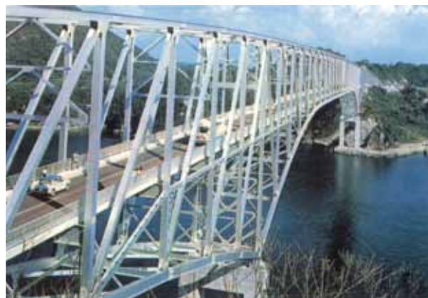
日本昔自動車風景 ～一枚の絵はがきから～ (其ノ二十一) (文：高井 淳 氏/企画・製作：ノスタルヂ屋)

九州は熊本県天草1号橋(天門橋)、大小120余りの島からなる天草と九州本土を結ぶ天草五橋の一つとして昭和41年開通して間もない頃の風景です。九州本土の宇土半島(宇土郡三角町)と天草(天草郡大矢野町)を結ぶこの橋は全長502mの連続トラス構造となっています。晴れた空とそれを映す海、2トーンに塗られた軽乗用車キャロルの屋根もお揃いの青い色です。