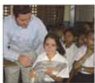
①年次基金寄付 今日を支える