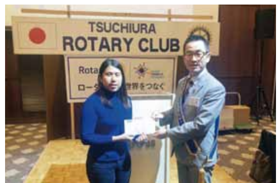
米山記念奨学生エーさんに奨学金を授与