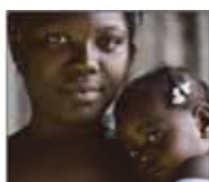
②恒久基金寄付 明日のために