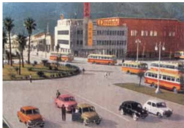
日本昔自動車風景 ～一枚の絵はがきから～ (文：高井 淳 氏／企画・製作：ノスタルヂ屋)

四国の東玄関となっている徳島県、徳島駅前風景です。時代は昭和30年代でしょうか、パステル調に塗られた初代トヨペットクラウンタクシーと、対照的に地味な色調のダットサンセダンが駐まっています。街を走るバスは当時としては珍しくキャブオーバー型が主流のようです。南国情緒あふれるロータリーのワシントンヤシは今でも駅前広場のシンボルであり続けています。