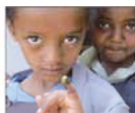
③使途指定寄付 ポリオ撲滅 など