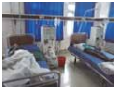
人道的プロジェクト