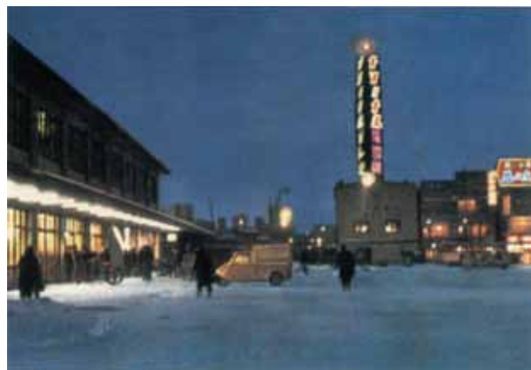
日本昔自動車風景 ～一枚の絵はがきから～ (文：高井 淳 氏／企画・製作：ノスタルヂ屋)

おそらく昭和30年代の後半～40年代の初め頃、青函連絡船（1988年3月に廃止）への乗り換え駅として機能していた時代がしのばれる青森県青森市の青森駅前です。路上の雪に映える駅舎と広告塔の灯。冷え冷えとした夜の街をことさらに強調する暖かそうな室内。雪国の冬を象徴する詩的な情景にマツダの軽三輪トラックK360が一台、点景として写り込んでいます。