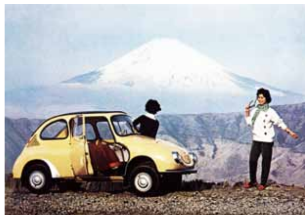
自動車にまつわる絵はがき (文：廣瀬 太/企画・製作：ノスタルチ屋)

スバル 360(1958年～1970年) 当時のカタログより、富士山を背景にスバル360。 スバル360は、富士重工業（現SUBARU）が開発した軽自動車 であり、のべ12年間に渡って生産されました。