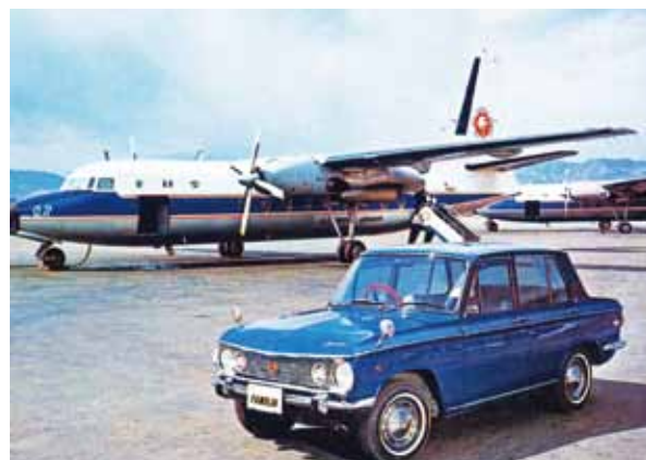
自動車にまつわる絵はがき