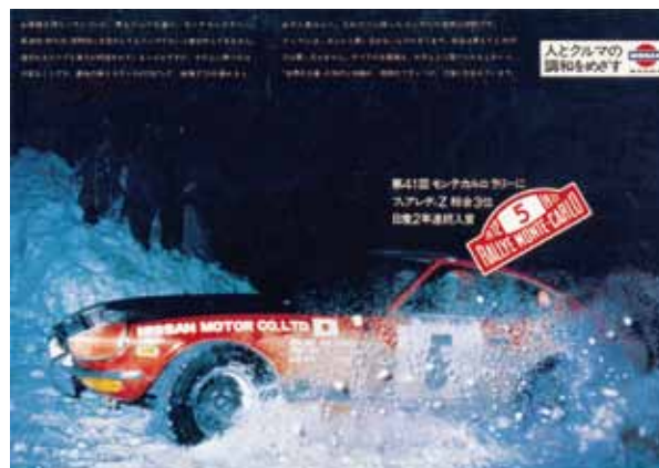
自動車にまつわる絵はがき (文：廣瀬 太/企画・製作：ノスタルチ屋)

日産 フェアレディZ (初代 1969年～1978年) 写真は1972年第41回モンテカルロラリー参加時のもので総合3位に入賞しました。この車両は現存しており、日産のヘリテージコレクションに所蔵されています。