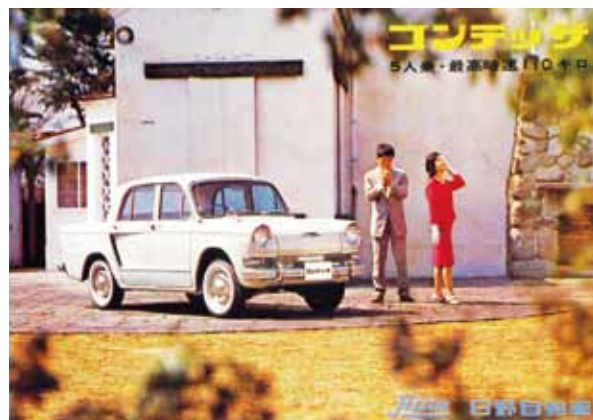
自動車にまつわる絵はがき (文：廣瀬 太/企画・製作：ノスタルチ屋)

日野 コンテッサ(初代 1961年～1964年) 現在は乗用車を生産していない日野自動車ですが、コンテッサは当時、初めて独自に開発したクルマでした。しかしながら1966年にトヨタと業務提携し、のちに乗用車の生産はトヨタの受託分のみとなりました。