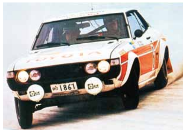
自動車にまつわる絵はがき (文：廣瀬 太／企画・製作：ノスタルチ屋)

トヨタ セリカ (初代 1970年～1977年) 1977年WRC(世界ラリー選手権)第2戦、第27回 インターナショナル・スウェーディッシュ・ラリーに参戦した時の一枚。 初代セリカは、現在ヤリスで参戦しているトヨタのWRCにおける先駆けとなりました。