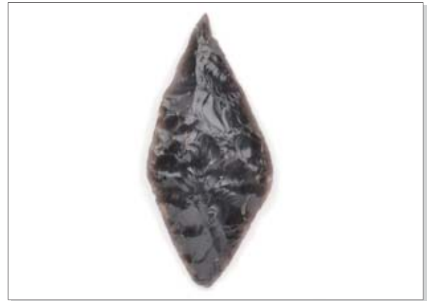
土浦ミュージアムコレクション No.4 槍先型尖頭器（男女倉型尖頭器）

前谷西遺跡（おおつ野）で出土した、黒曜石でできた槍の穂先です。長さは7cm程度、約2万年前の旧石器時代のもので、先端左側に「槌状剥離」という縦長の剥離が施されていることが特徴です。 (上高津貝塚ふるさと歴史の広場蔵)