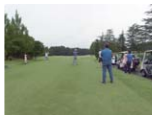
7月25日(土) 静ヒルズカントリークラブにて