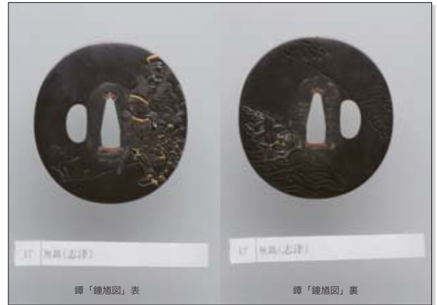
土浦ミュージアムコレクション No.7 鐘「鐘馗図」(江戸時代後期)部分

江戸時代中期の金工 はまのしょうすい 浜野政随の作です。鐘馗は疫病を祓うと信じられていました。日本では魔除けとして端午の節句に人形を飾ることもありました。 (土浦市立博物館所蔵)