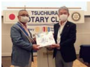
卓話ありがとうございました

8/25に開催された第31回かすみがうらマラソン (兼)国際盲人マラソン実行委員会に於いて、感謝 状を頂きました。