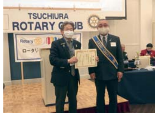
ローター財団、米山記念奨学会への寄付 目録贈呈