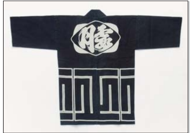
土浦ミュージアムコレクション No.32 印半纏（昭和初期）

大紋はひし形の囲いの中に「霞月」、衿には「霞月楼」の衿字が染め抜かれています。霞月楼で仕事をした庭師が所持した印半纏です。店の主人から認められた者にのみ与えられたそうです 〈土浦市立博物館所蔵〉