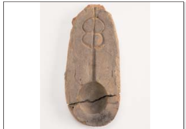
土浦ミュージアムコレクション No.36