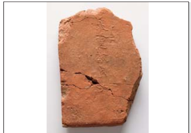
土浦ミュージアムコレクション No.37