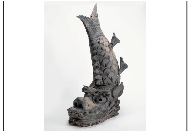
土浦ミュージアムコレクション No.43